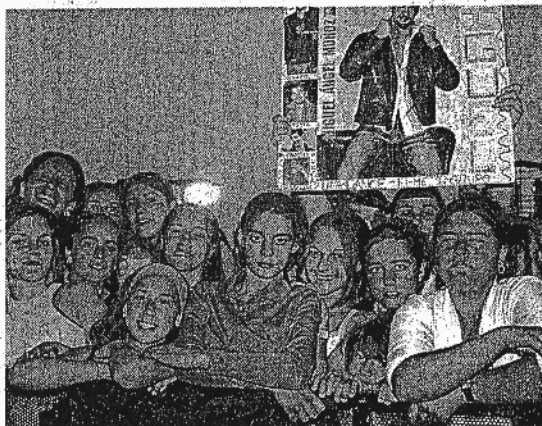
El espectáculo de los artistas televisivos cautivó a las adolescentes. Sobre estas líneas, Miguel Ángel Muñoz, Beatriz Luengo y Pablo Puyol.

Tras el shock inicial, sufrido especialmente por el público fe-